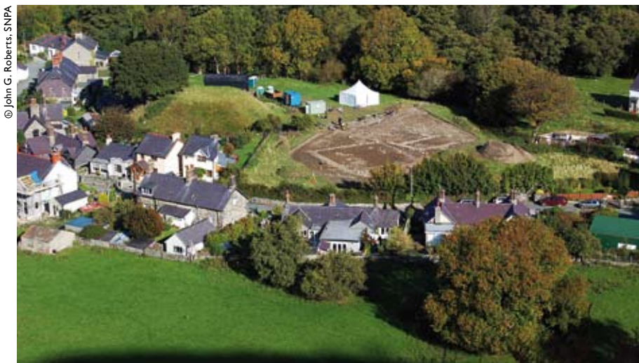
Mae'r domen, y credir ei bod yn domen castell (Ymweliad 1), ar y chwith yn y llun yma o'r cloddio yn Aberystwyth yn 2010

Fodd bynnag, mae union safle llys Aber yn destun dadl. Mae traddodiad lleol a rhai awduron diweddarach yn ei gysylltu â Phen y Bryn, tŷ a thŵr crand uwchlaw'r pentref. Mae'n bosib y bydd gwaith cloddio newydd sy'n digwydd yn yr ardal ger y mwnt yn talfu rhagor o oleuni ar leoliad y llys ac elfennau eraill o Aber y Canol Oesoedd.