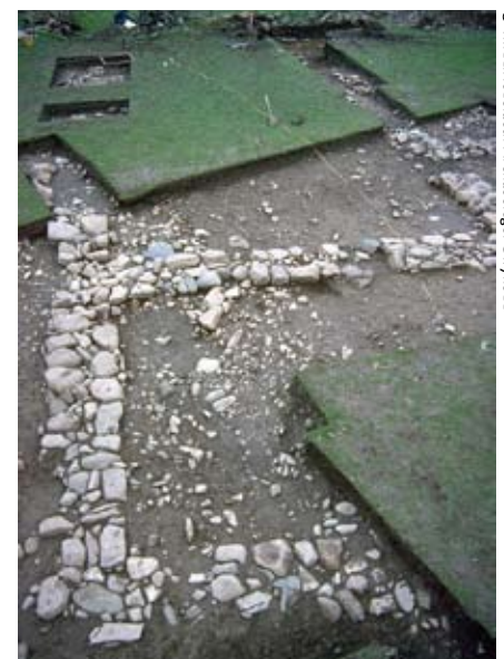
Sylfeini'r neuadd wedi'u datgelu gan waith cloddio 1993