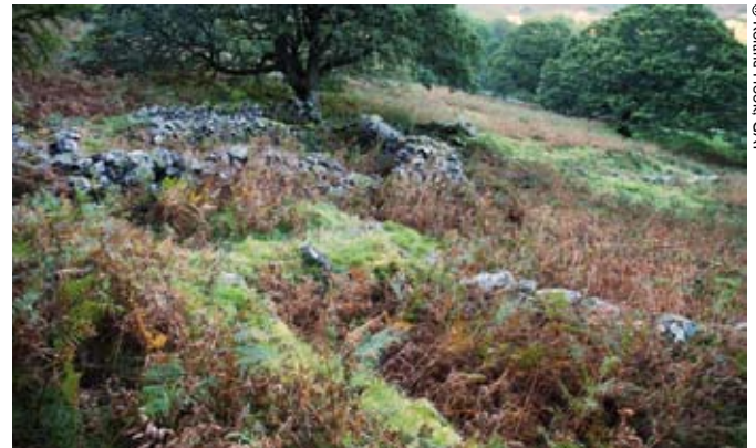
Nodwyd bod dau o'r adeiladau yn y clwstwr hwn o gytiau hir yn deillio'n ôl i'r drydedd ganrif ar ddeg (Ymweliad 3)