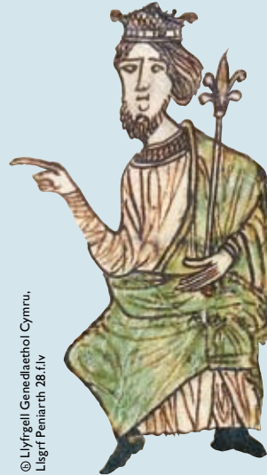
© Llyfrgell Genedlaethol Cymru, Llyfr Peniarth 28.f.v

Yn ogystal â'u gwasanaethau llafur, roedd yn rhaid i'r taeogion dalu taliadau