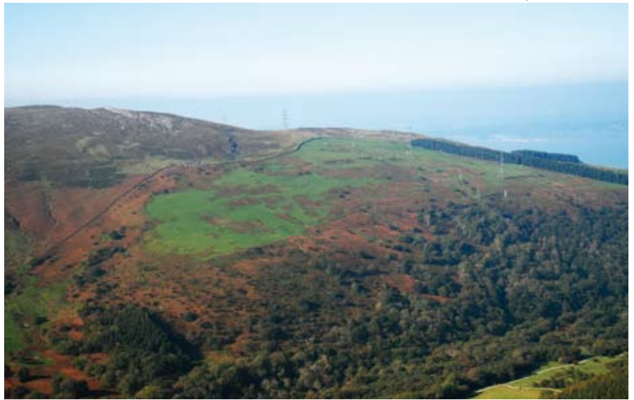
Mae tirwedd Cae'r Mynydd (Ymweliad 5) yn dangos olion caeau ac aneddiadau o Oes yr Haearn, yn ogystal ag aredig canoloesol a chytiau hir