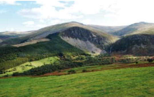
Ucheldir glaswelltlog Cae'r Mynydd gyda Rhaeadr Fawr yn y pellter

cartrefi'r bobl oedd yn cyfuno rheolaeth fwy dwys o'r tiroedd pori brenhinol gyda phori tymhorol. Mae'n bosib bod y pâr o adeiladau canoloesol lle bu cloddio yn y dyffryn yn gysylltiedig â datblygiad y ffriddoedd.