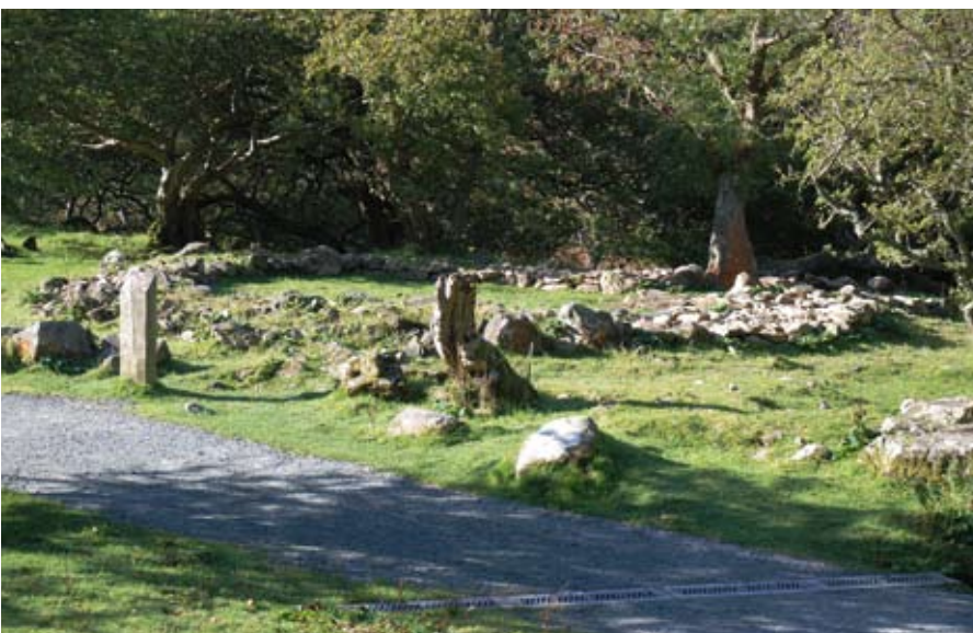
Y tŷ crwn o Oes yr Haearn a ddaeth yn safle i odyn sychu grawn yn y Canol Oesoedd (Ymweliad 4)