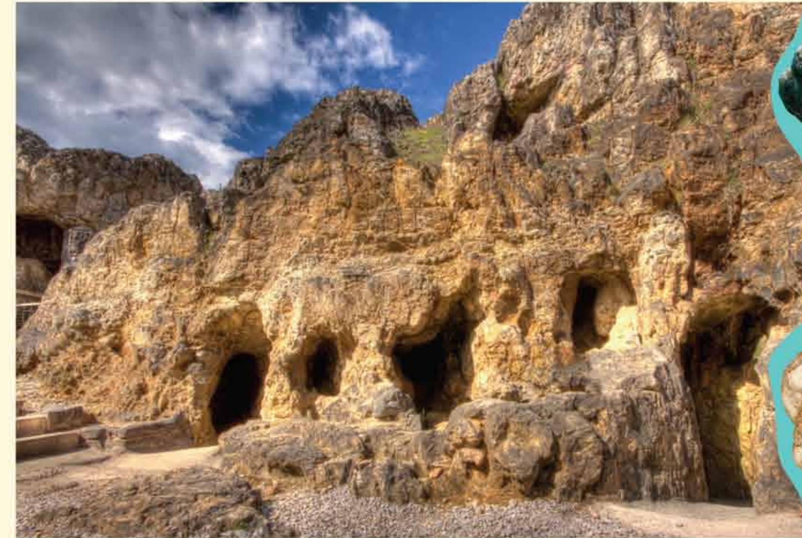
Mwyngloddiau Y Gogarth Great Orme Mines