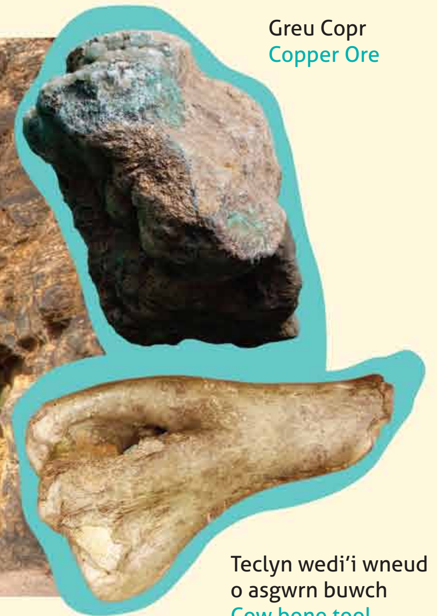
Greu Copr Copper Ore