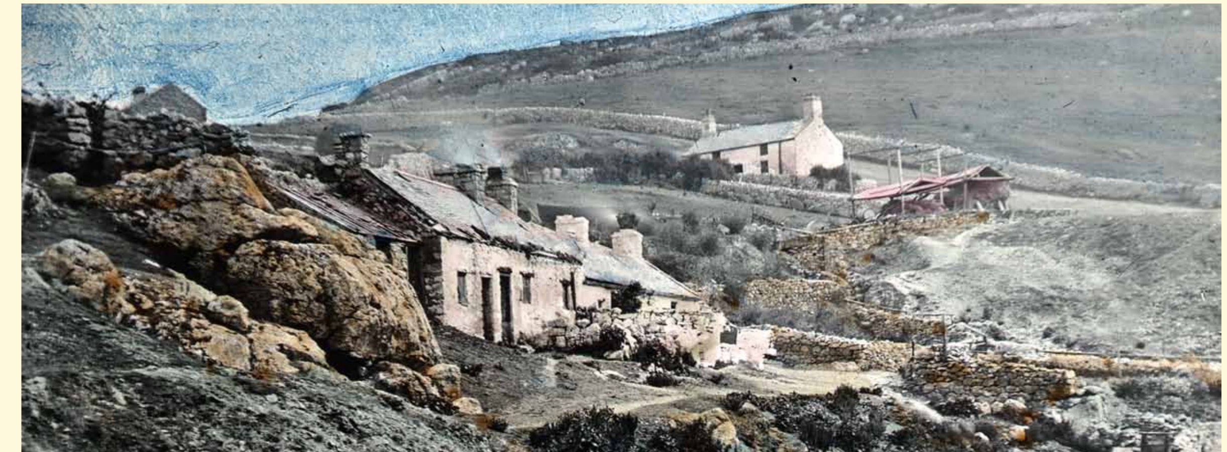
Bythynnod mwynwyr ar y Gogarth Miners' cottages on the Great Orme

I echdynnu mwyn, roedd yn rhaid tynnu dŵr o'r gweithfeydd 300 troedfedd o dan y ddaear. Roedd dyfais 'Flop Jack' yn pwmpio dŵr i fyny o'r gweithfeydd tanddaearol. Y cyfan sy'n weddill heddiw yw cyfres o byllau yr oedd y system yn gweithio arnynt. Mae'r pyllau'n ymestyn o'r Mwynglawdd Newydd i Ffynnon Gogarth, ychydig yn is i lawr na'r fan lle'r ydych yn sefyll. Roedd pob pwll yn cynnwys ffrâm siâp 'A' o wialenni cyswllt a oedd yn cael eu gyrru gan ddefnyddio dŵr o'r ffynnon ac yn gyrru'r pwmp yn eu tro. Roedd y ddyfais bwmpio'n cael ei galw'n 'Tom a Jerry', a enwyd nid ar ôl y cartŵn ond ar ôl dau gymeriad terfysglyd yng nghylchgrawn Pierce Egan 'Life in London'.