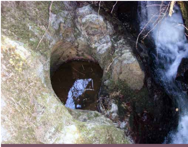
Ffynnon Gwyfan, Tudweiliog

Mae nifer helaeth o'r ffynhonnau yn Llŷn wedi'u lleoli ar Lwybrau Pererinion Enlli sy'n arwain i ben daw Llŷn. Credent yn eu gallu meddyginiaethol a hawdd dychmygu'r pererinion yn llusgo'n flinderus yn eu gwendid tuag atynt. Gwyddom am rai o'r ffynhonnau ond aeth cyfrinachau'r lleill ar ddifancoll ers canrifoedd.