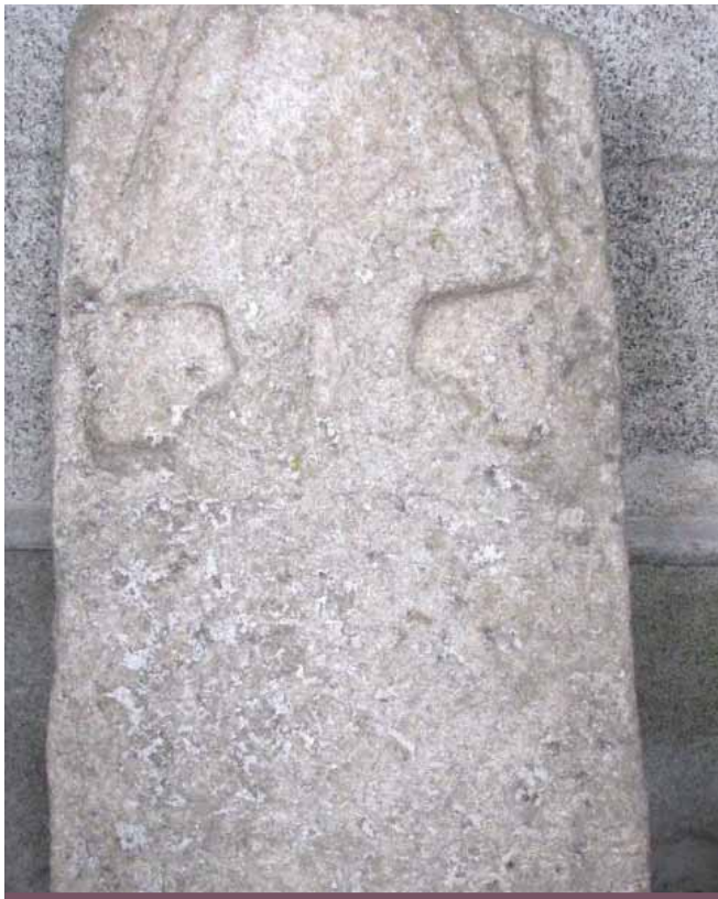
Carreg fedd gyda gwisg pererin arni (Ynys Enlli)

Ymledodd Cristnogaeth i Lŷn trwy genhadaeth y 'seintiau'. Nhw oedd y pererinion cenhadol a fyddai'n crwydro gan sefydlu llannau yma ac acw. Mae'r ffynhonnau sanctaidd a'r meini Cristnogol cynnar yn dystiolaeth o hynny.