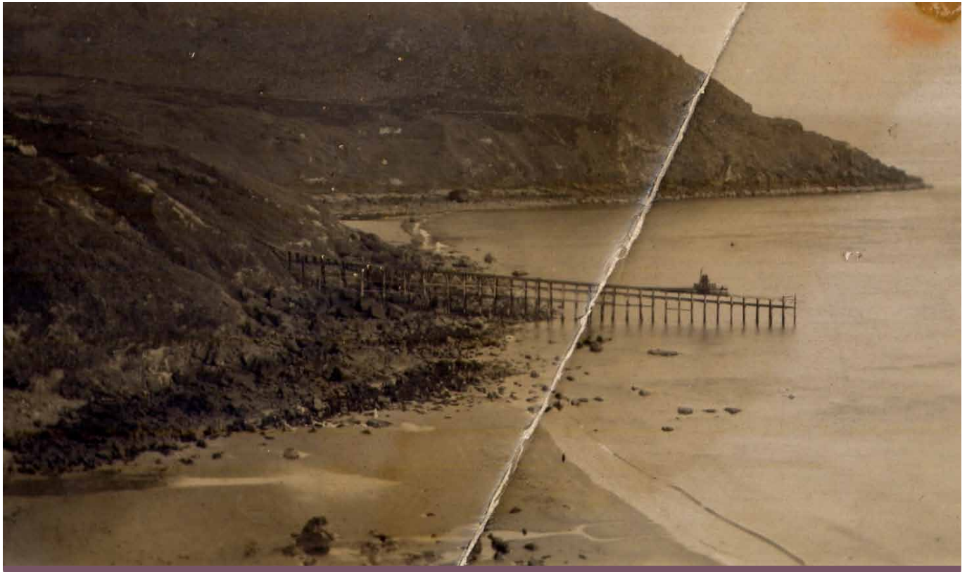
Glanfa Porth Ysgo