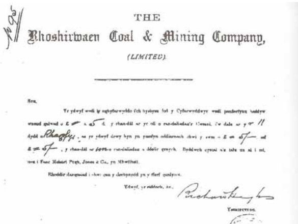
Tystysgrif y Cwmni Glo

Cafodd glo ei ddarganfod yn ardal Hebron, Llangwnnadr ac yn Rhosirwaun yn y 19egG ac aed ati i archwilio. Yn 1837 ar dir Brynhunog Fawr ac yn Rhos Cabli yn 1844 cafodd ei gloddio.