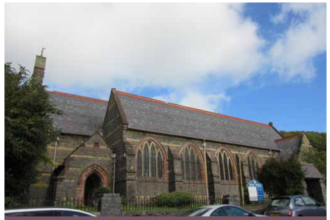
Eglwys Sant Pedr

Cyfarwyddiadau: Eglwys Sant Pedr: Ar y chwith yn Lleiniau (sy'n arwain i Bentre-poeth). Ar ben uchaf Stryd y Llan sy'n arwain o'r Stryd Fawr.