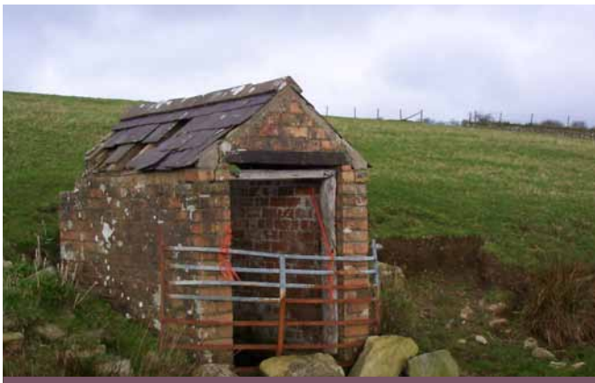
Ffynnon Cawrdaf, Abererch

Mae nifer helaeth o'r ffynhonnau yn Llŷn wedi'u lleoli ar Lwybrau Pererinion Enlli sy'n arwain i ben daw Llŷn. Credent yn eu gallu meddyginiaethol a hawdd dychmygu'r pererinion yn llusgo'n flinderus yn eu gwendid tuag atynt. Gwyddom am rai o'r ffynhonnau ond aeth cyfrinachau'r lleill i ddifancoll ers canrifoedd.