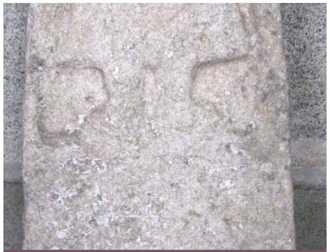
Carreg fedd gyda gwisg pererin arni (Ynys Enlli)