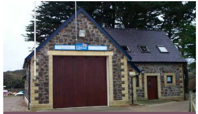
Cwt Bad Achub presennol Abersoch

Cyfarwyddiadau: Gorsaf Bad Achub Abersoch – Dilynwch arwyddion oddi ar y A499 (Abersoch – Llanbedrog) wrth adael y pentref.