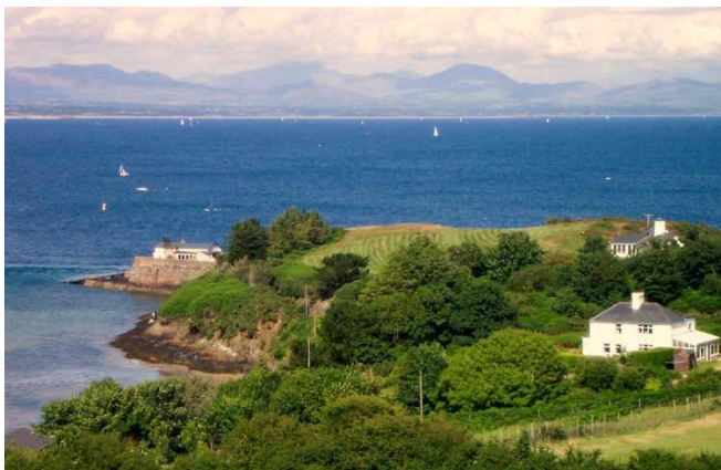
Safle Cwt Bad Achub cyntaf Abersoch

Pan gafodd y 'Mabel Louise' ei galw y tro cyntaf, yn Ionawr 1870 wynebodd dywydd gaeafol iawn.