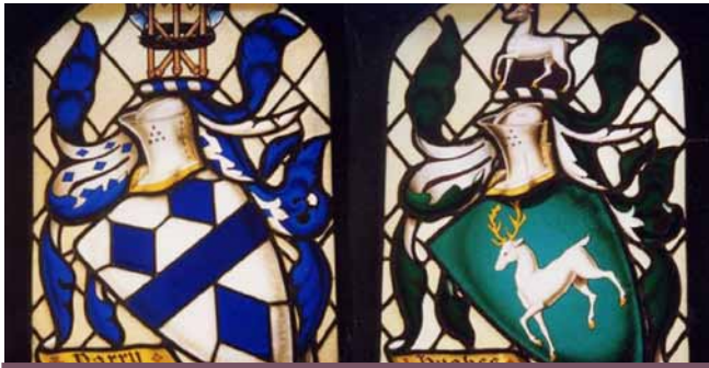
Mewn ffenestr ym Mhlas Glyn y Weddw