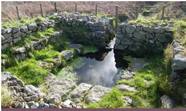
Ffynnon Fyw, Mynytho

Byddai'r pererinion ar eu ffordd i Ynys Enlli yn sicr o fod wedi galw yn Ffynnon Pedrog, Llanbedrog ac yn Ffynnon Engan, Llanengan neu yn Ffynnon Fyw, Mynytho.