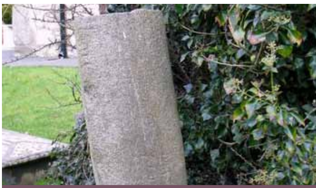
Carreg Melus, Llangian

Wrth brif fynedfa Plas Glyn y Weddw fe welwch ddwy garreg hynod iawn. Fe'u gelwi yn Gerrig Penprys am iddynt cael eu darganfod ar fferm Tir Gwyn, Llannor yn y 19eG.