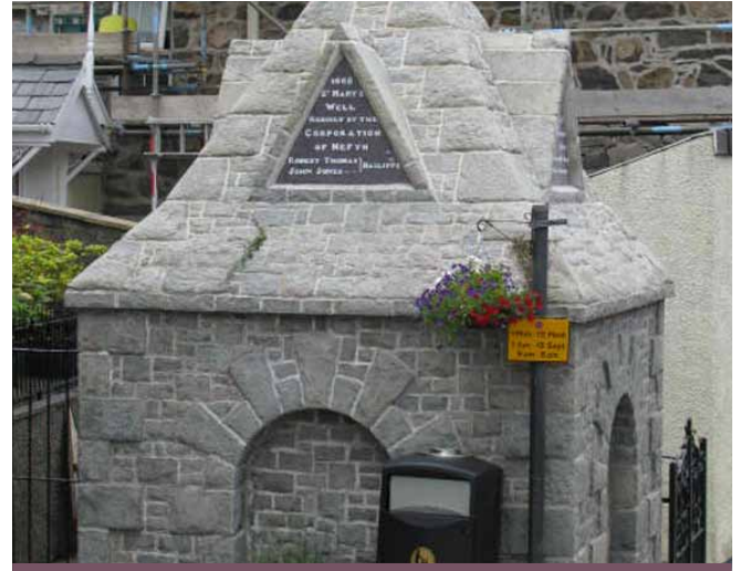
Ffynnon Fair Nefyn

Ceir amryw o ffynhonnau sanctaidd ar Lwybr y Pererinion yn ardal Nefyn a'r Eifl.