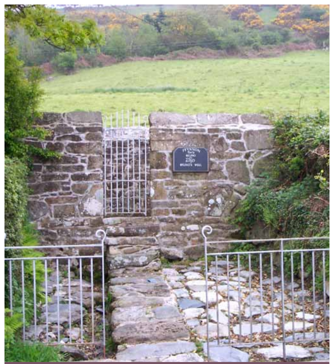
Ffynnon Beuno, Clynnog Fawr