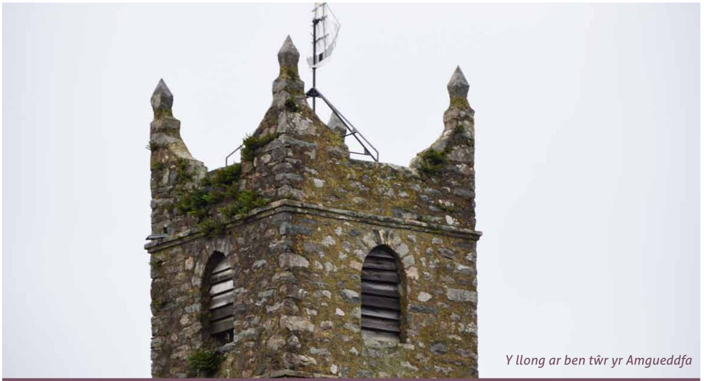
Y llong ar ben tŵr yr Amgueddfa