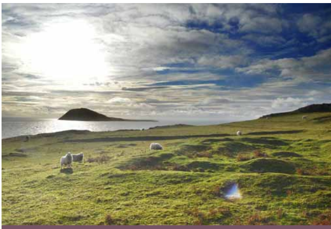
Olion Capel Mair ar y dde

Dilynwch y ffordd o Aberdaron trwy Uwchmynydd ac i dir yr Ymddiriedolaeth Genedlaethol – 'Mynydd Mawr'.