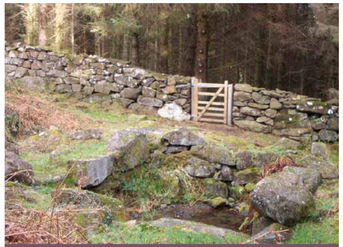
Ffynnon Saint, Rhiw