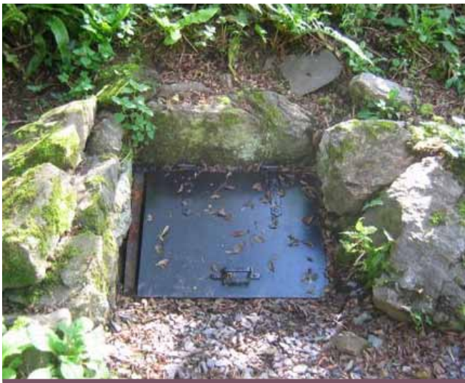
Ffynnon Saint, Aberdaron