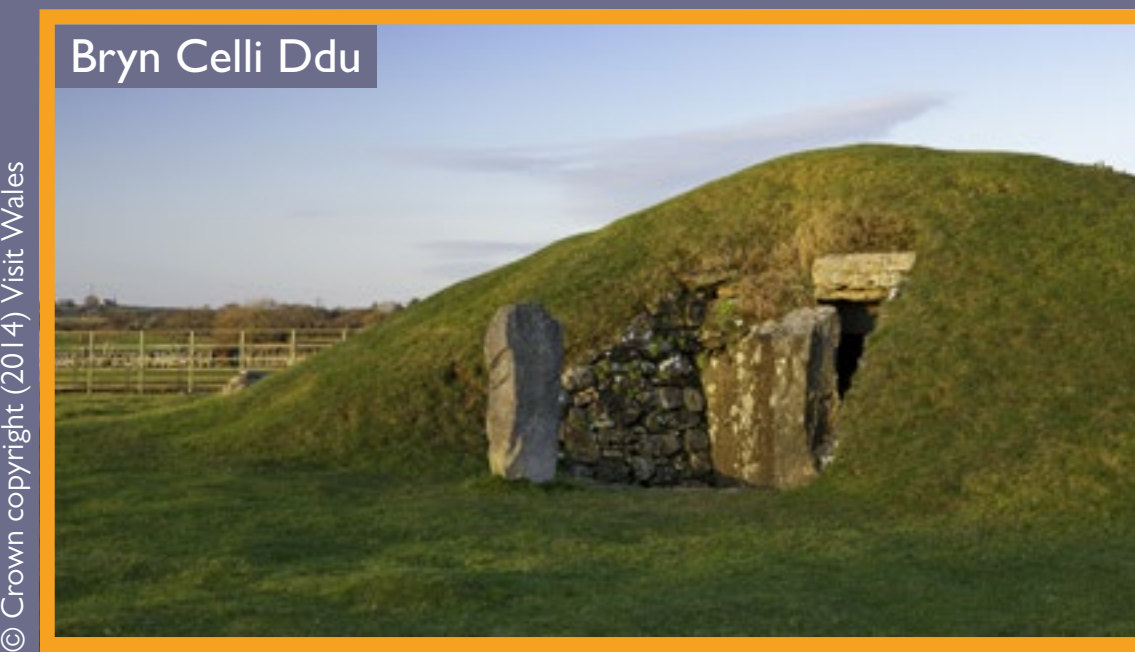
Bryn Celli Ddu