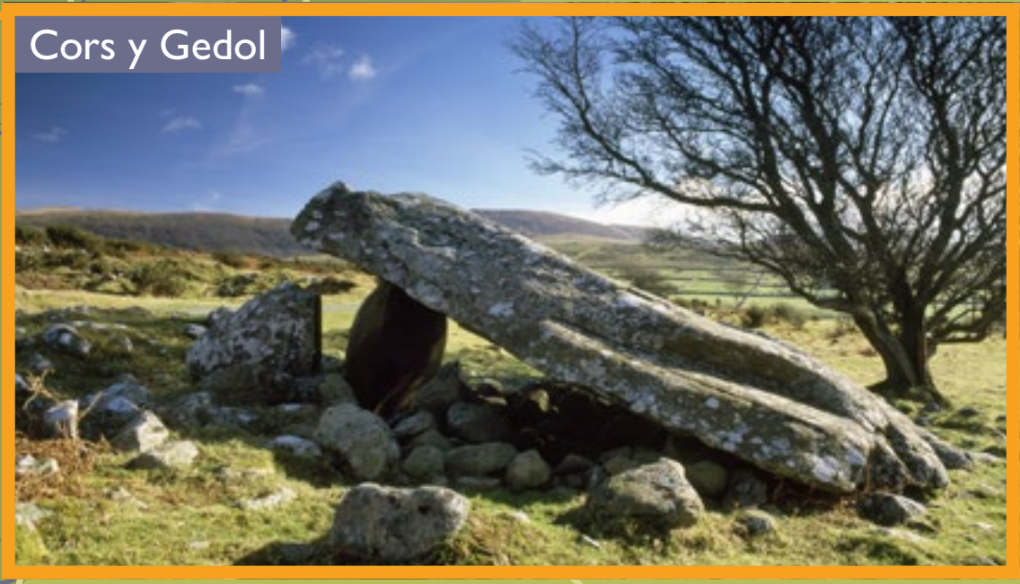
Cors y Gedol